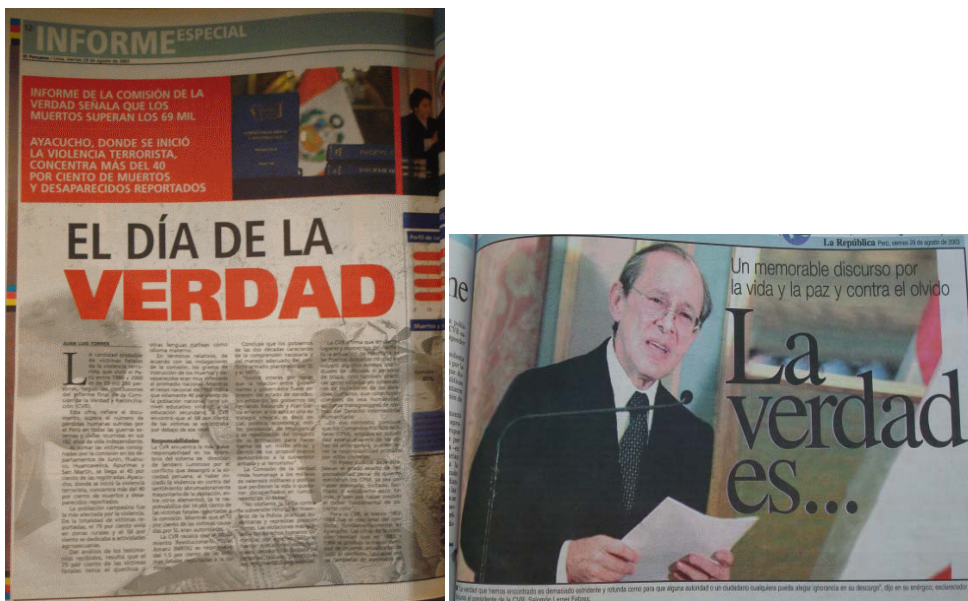
El Peruano: "El día de la verdad", La República "Y la verdad es...."