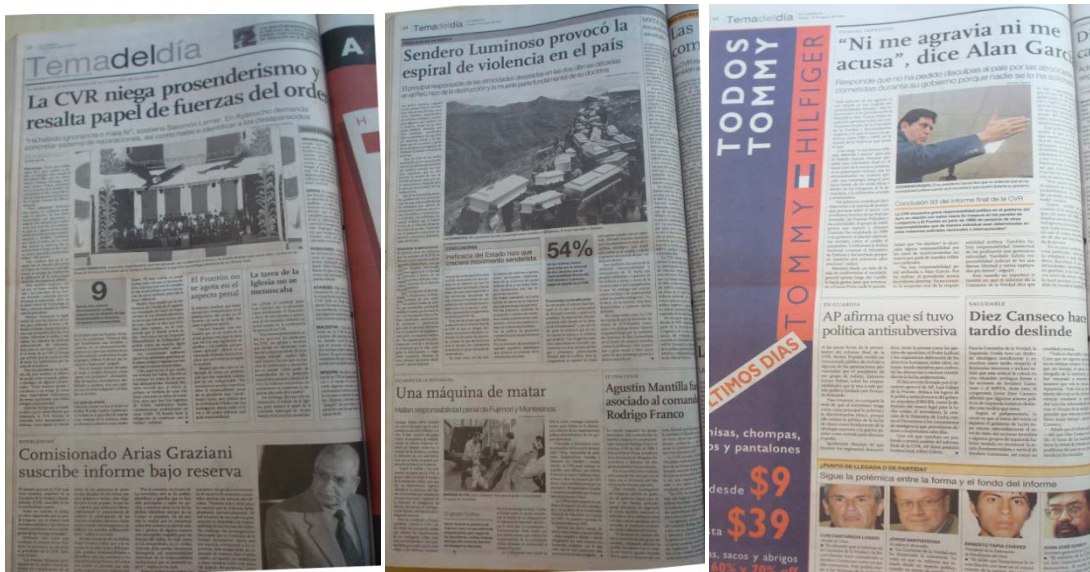
El Comercio 30/08/2003