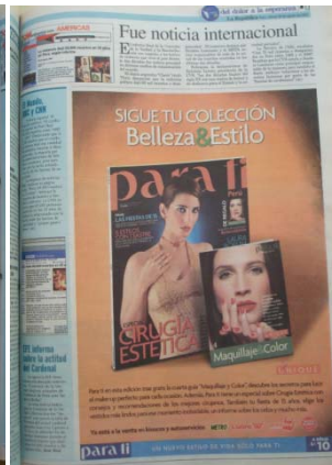
La República 29/08/2003