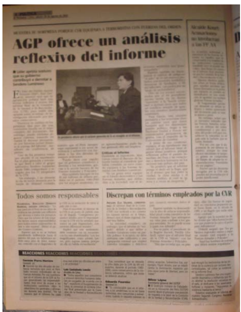
El Peruano 30/08/2003