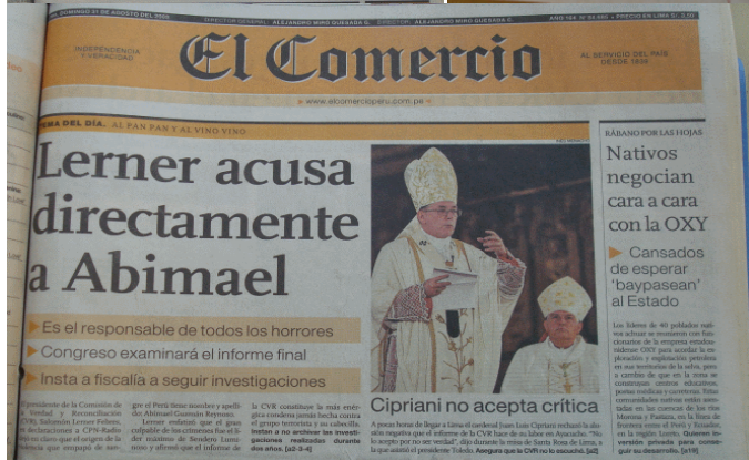
El Comercio, 28, 29, 30 y 31 de agosto de 2003