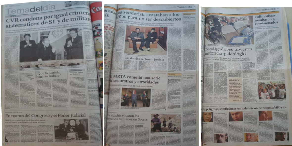
El Comercio 29/08/2003