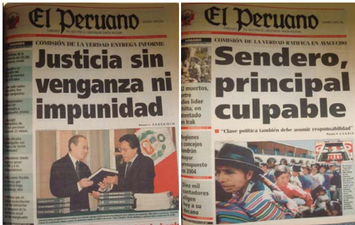
El Peruano, 29 y 30 de agosto de 2003