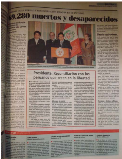
El Peruano 29/08/2003