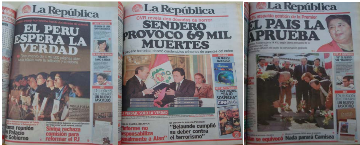
La República, 28, 29 y 30 de agosto de 2003