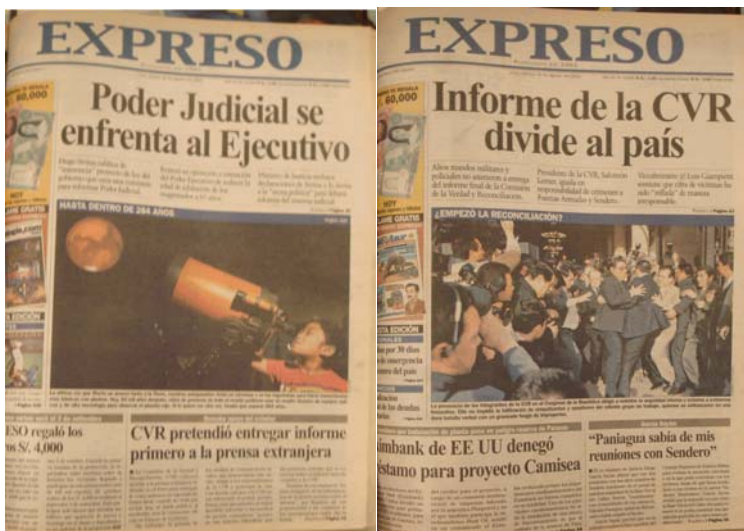
Expreso, 28, 29 y 30 de agosto de 2003