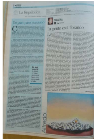
La República 30/08/2003