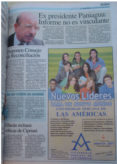
La República 31/08/2003